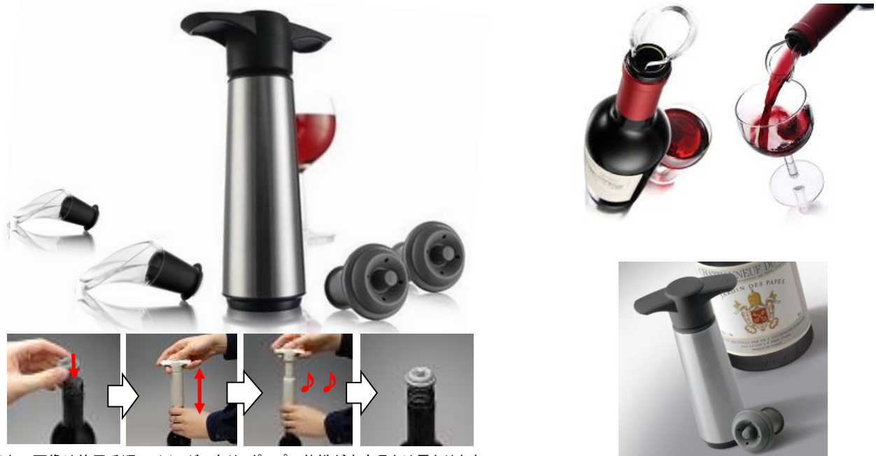
※上の画像は使用手順のイメージであり、ポンプの仕様が本商品とは異なります。