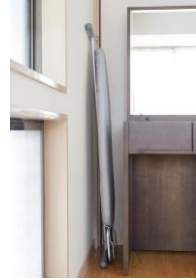
折りたたむと厚さわずか10cm。ちょっとした隙間でも楽々収納。