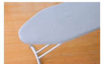
カバーは焦げにくくパリツと仕上がるアルミコーティング仕様。