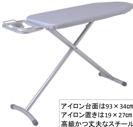
アイロン台面は93×34cm アイロン置きは19×27cm 高級かつ丈夫なスチール製