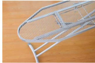
アイロン台面はスチールメッシュ仕様。