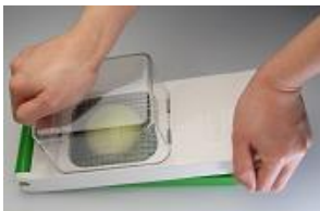
② 上からスライサーをグッと押す