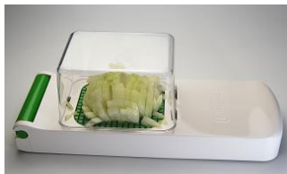
③ みじん切りになった玉ねぎは、透明容器の中に入る