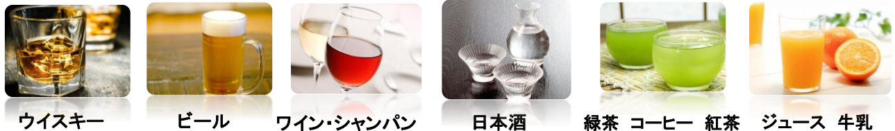
ウイスキー ビール ワイン・シャンパン 日本酒 緑茶 コーヒー 紅茶 ジュース 牛乳