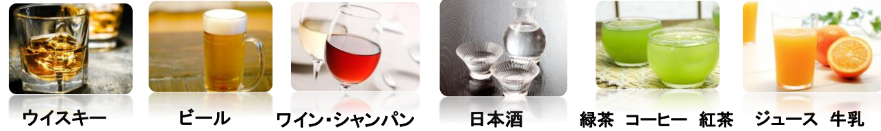
ウイスキー ビール ワイン・シャンパン 日本酒 緑茶 コーヒー 紅茶 ジュース 牛乳