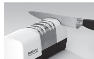
日常のメンテナンスは仕上げ研ぎ(手動)のみで OK