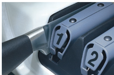
① 荒研ぎ(ダイヤモンド研磨材) 刃こぼれがひどいときに使います。

包丁の状態に合わせて研ぎ部を選び、溝型のスロットに入れて手前に1回から3回ゆっくり引くだけで簡単に研ぐことができます。