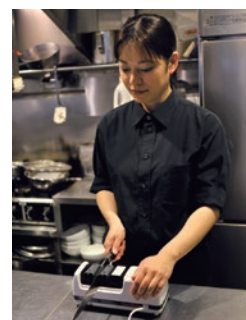
パートやアルバイトの方でも簡単に使用できる (都内焼肉店 使用例)

(注)両刃・片刃用です。セラミック包丁、和包丁(刺身・出刃等)、ハサミ、工具などには使用できません。砥石用の水や油、潤滑油は不要です。