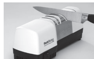
中研ぎ(電動)でしっかりバリをつける

(注) 両刃専用です。セラミック包丁、和包丁(刺身・出刃等)、ハサミ、工具などには使用できません。砥石用の水や油、潤滑油は不要です。