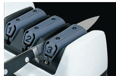
③ 仕上げ研ぎ (酸化アルミニウムポリマー) 刃を滑らかに仕上げます。