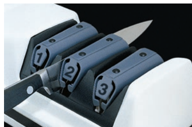
② 中研ぎ(ダイヤモンド研磨材) 仕上げ前のバリを作ります。